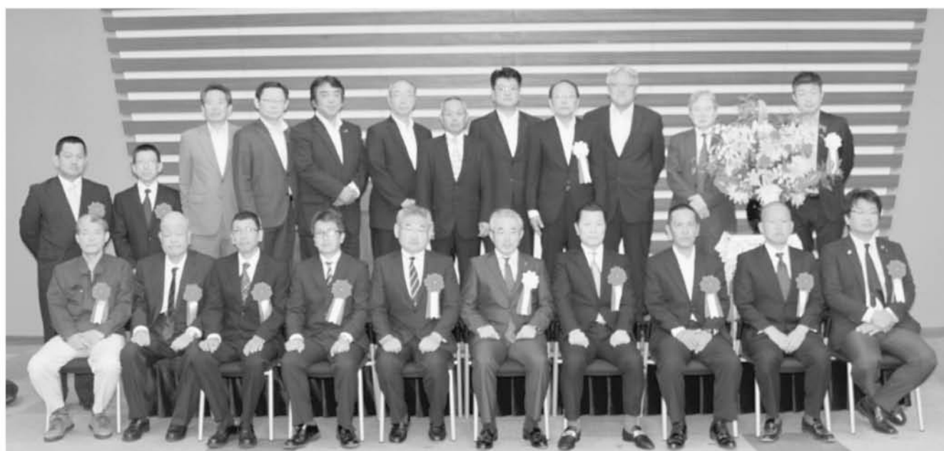
会長表彰を受賞された方及び新役員