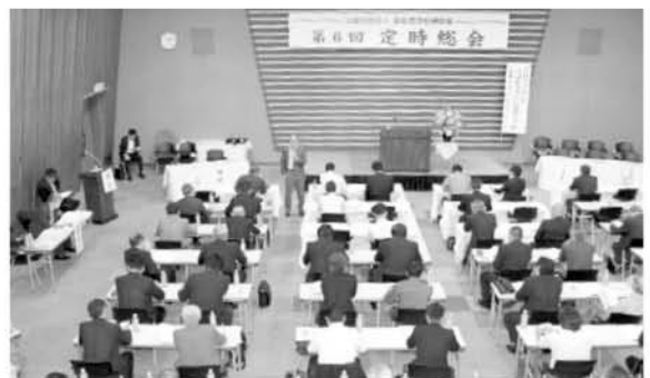
講演会場のようす