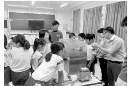
顕微鏡をのぞく 東部小学校の児童たち