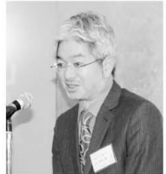
長坂県理事からご挨拶