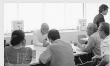
個別相談のようす