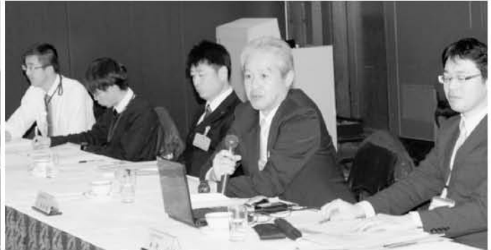
ご出席いただいた行政の皆様