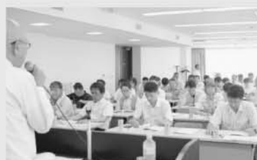
説明を聞く参加者