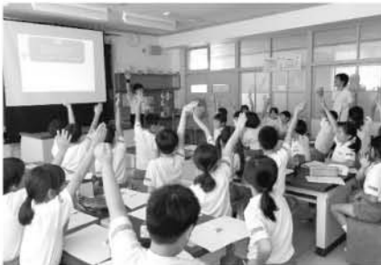
クイズに挑戦する 大谷小学校の児童たち