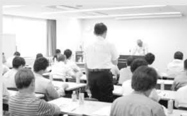
質問をする浄化槽設置者