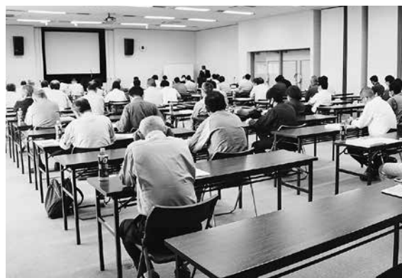
令和3年度 浄化槽管理士研修会の様子